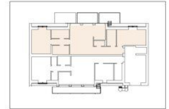
Übersicht DG 1