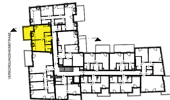
FUß- UND RADWEG